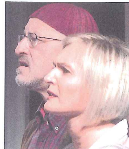
Einen Volltreffer gelandet:

ist der Burgtheateraufführung von 2008 nachempfunden: Damals wurde eine Wagenladung Baumstämme auf die Bühne geleert, die wie riesige Mikadostäbe ineinander verkeilt waren. Im Resch-Haus in Innichen sind es massive Holzklötze, die mit starken Brettern verbunden sind,